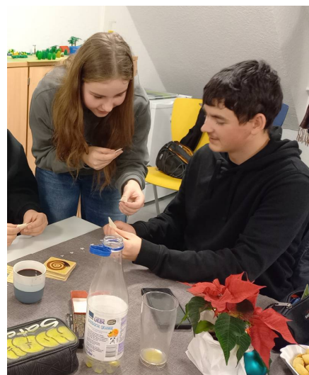
Etwas Landeskunde in der Weihnachtszeit: traditionelles Oblatenteilen