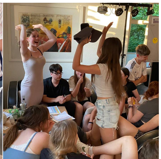
Deutsch-polnische Teamarbeit beim Quiz „Unnützes Wissen über Deutschland“ und glückliche Siegerinnen.