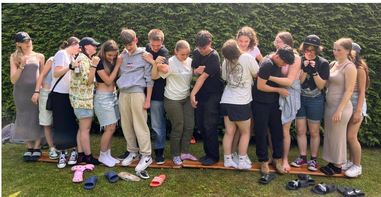
Alle auf „ein“ Brett: Geschicklichkeitsübung, die Polen und Deutsche einander näher brachte.

ben auf dem Lande gestern und heute“ verbrachten sie fünf Tage mit den Schneverdingern, die das Programm selbst vorbereitet hatten. Polen und Deutsche übernachteten gemeinsam im Feriendorf am Pietzmoor.