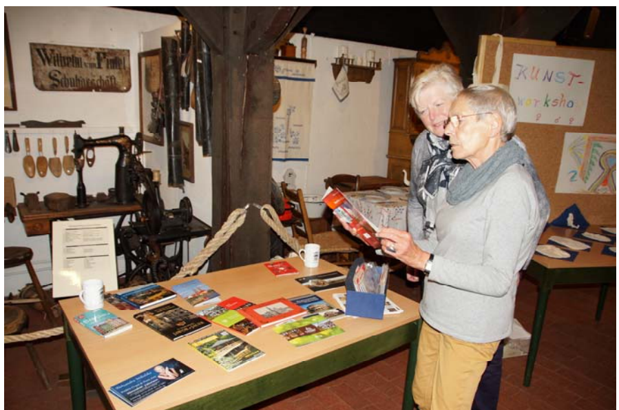
Die DPG ist regelmäßig bei anderen Vereinen zu Gast, um ihre Veranstaltungen durchzuführen (hier: polnischer Nachmittag auf dem Theeshof)

Der Heimatbund Schneverdingen, dessen Vorsitzender auch im Vorstand der DPG sitzt, hat guten Kon-