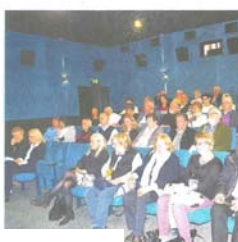
Mitgliederversammlung der DPG

Der weitere bisherige Vorstand wurde in einzeln durchgeführten Wahlgängen in seinen Ämtern bestätigt; neue im Vorstand sind