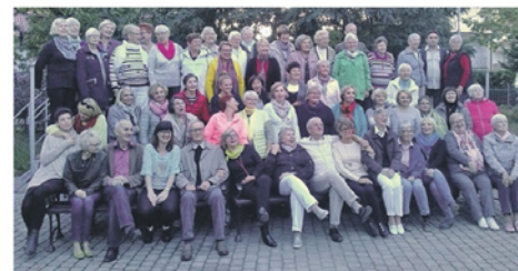
Mitglieder und Gäste des Frauenchores bei ihrer Reise in Polen.

schluss folgte ein Festbankett im geschmackvollen Saal des Kulturzentrums Panoroma. Am nächsten Morgen zum Schlußakt auf dem Barliner See bei schönsten Wetter. Nachmittags ging es zum Dendrologischen Garten in Przelawitz mit Schloss und Orangerie, und abends auf Einladung vom Chor Halika ins europäische Kulturzentrum. Im Obergeschoss des Europäischen Kulturzentrums konnte eine Ausstellung der polnischen Künstlerin Romana Kaszycy besucht werden. Sie hat Märchen und Legenden um Barlinek gesammelt und wunderschöne, geheimnisvolle Bilder dazu gemalt. Der vierte Tag, der Abschied von Barlinek. Die Reise ging weiter nach Sretnin. Eine quitzige, hochinteressante Stadt mit unglaublich vielen Grünflächen. Dann ging es aber wirklich nach Hause. Es dauerte noch eine ganze Weile bis der Chor in Schneverdingen ankam. Gatzlun Wunjak 827723