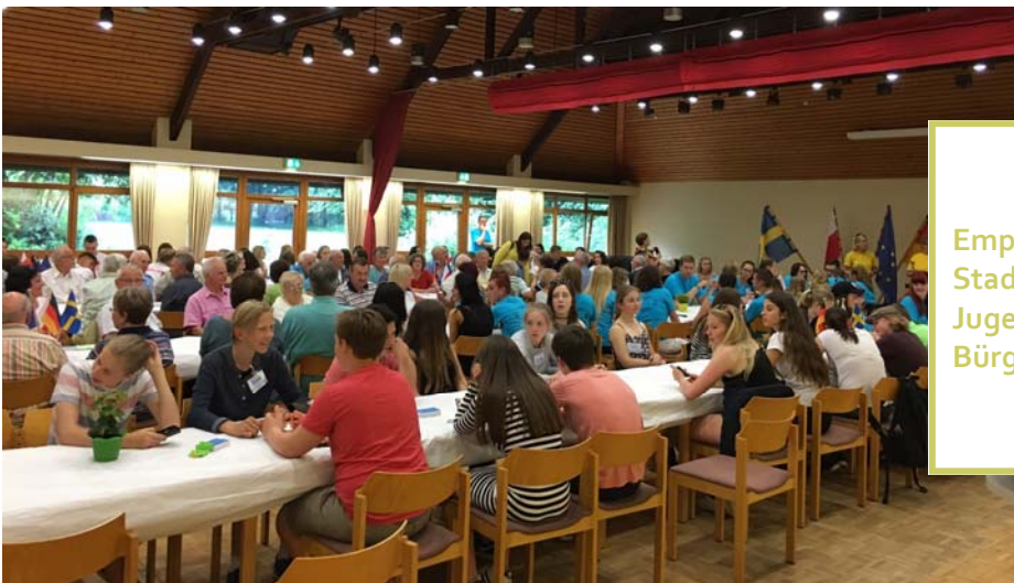
Empfang der Gäste zum Stadtfest und zur Jugendbegegnung im Bürgersaal

Die DPG ist gerne weiter dabei, weil es einfach Spaß macht, das zu unterstützen!