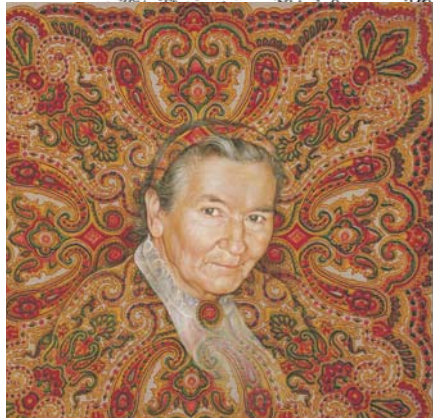
Liczka verwendet Kindgemälde der Partisantinnen und schafft eine einmalige Verbindung mit dem Lebenslauf des