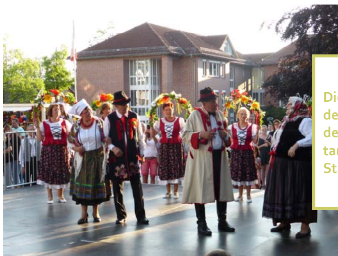
Die Tanzgruppe der „Universität der 3. Generation“ tanzt auf dem Stadtfest

Wir sind sicher, dass wir nicht das letzte Mal von der Universität der Dritten Generation gehört haben werden und wollen den Kontakt aufrechterhalten.