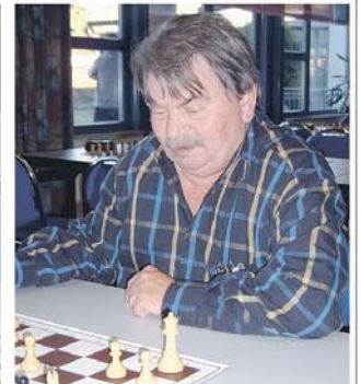
Jablonski ein Jungpund. De Pole war mit 91 Jahren Älteste im Feld, landete auf Platz 58. Nach den ersten vier von insgesamt neun Runden führte Bu