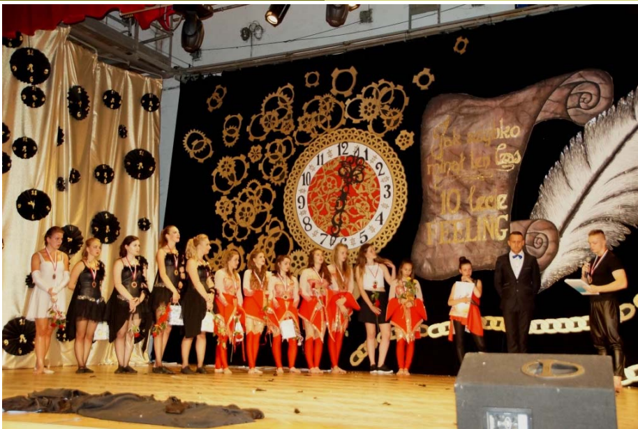
Eine phantasievolle Bühnendekoration und kreative Kostüme zeichneten die Tanzgala von „Feeling“ aus. Ist das ein Vorgeschmack auf die Vorstellung am 25.02.2017 in Schneverdingen?